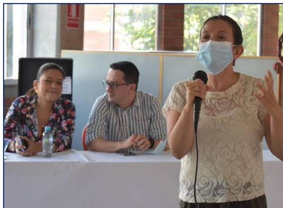
Primera Mesa anfitrión I.E. Francisco de Paula Santander