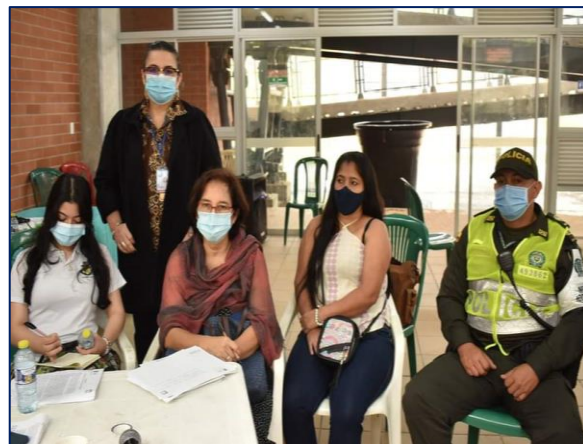
Segunda Mesa anfitrión I.E. Ciudad de Ibagué