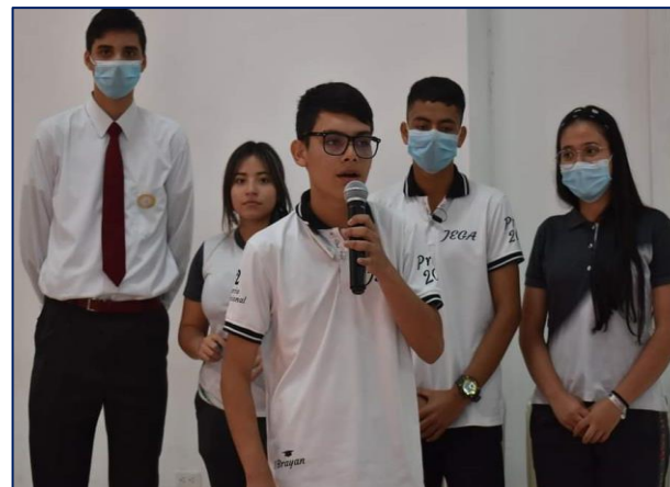
Tercera Mesa anfitrión I.E. Liceo Nacional