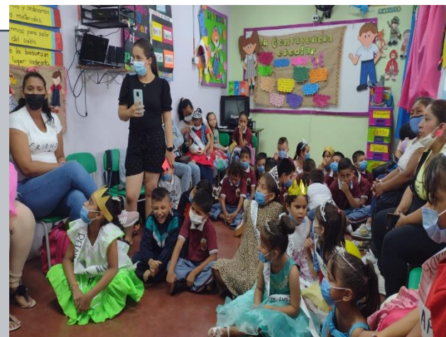
I.E. Miguel de Cervantes Saavedra